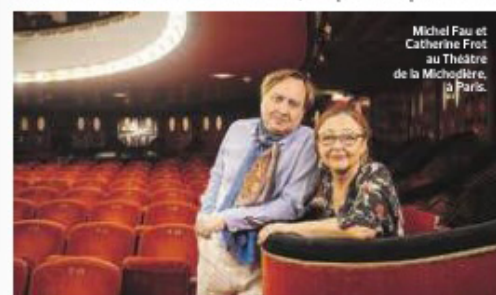
Michel Fau et Catherine Frot au Théâtre de la Michodière, à Paris.