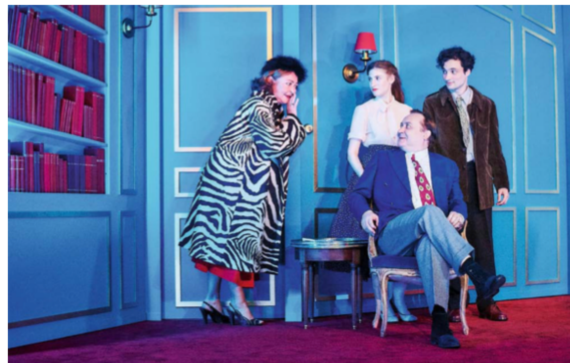
« Lorsque l'enfant paraît », actuellement au théâtre de la Michodière, Paris II*.

J'ai trouvé qu'il était une nécessité absolue. Mais tout ce qu'on a pu entendre m'a estomaquée. C'était d'une violence inouïe. Quand j'ai débuté, je savais que les rapports hommes-femmes étaient avant tout des rapports de pouvoir, qui pouvaient parfois se transformer en abus sexuels... Moi, j'avais tendance à ne pas avoir peur quand j'étais jeune. Je me suis retrouvée parfois dans des positions difficiles face à des hommes de pouvoir. J'ai toujours pris la direction qui