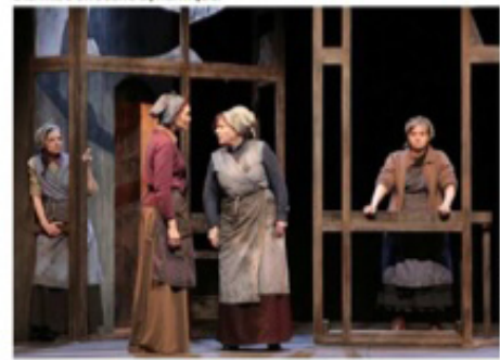
« Les filles aux mains jaunes », travaillent dans une usine d'armement en 14-18 et se rebellent : un récit puissant à la mise en scène dynamique.