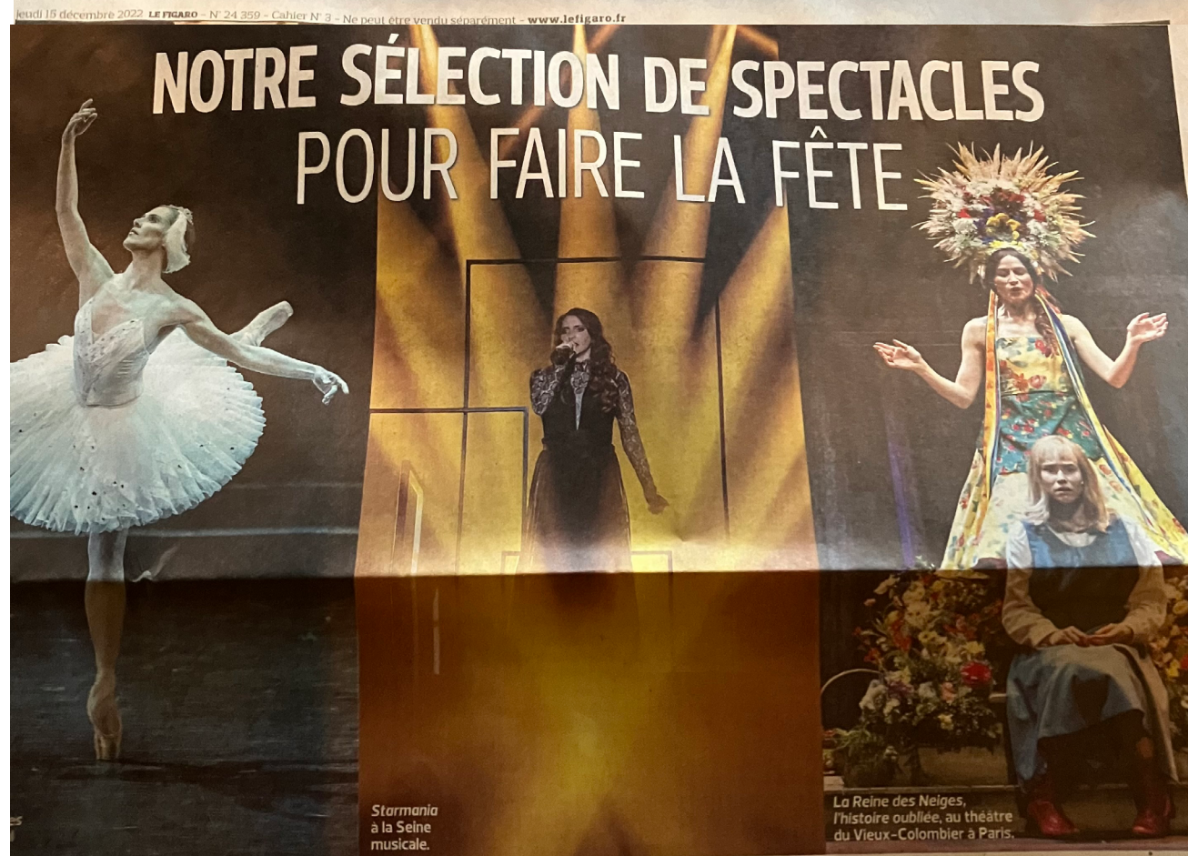
Starmania à la Seine musicale.