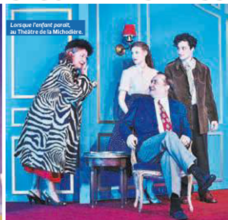
Lorsque l'enfant paraît, au Théâtre de la Michodière.